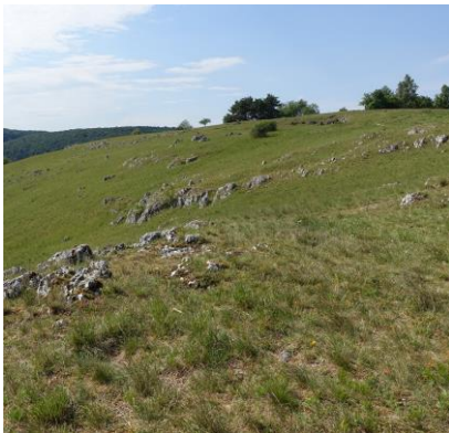
Kalkmagerrasen mit seltenen Pflanzenarten

Später breiten sich Baumarten aus und schließlich entsteht Wald.